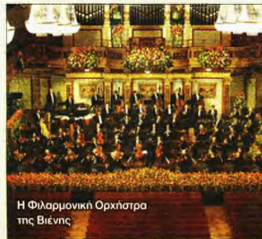
Η Φιλαρμονική Ορχήστρα της Βιέννης

Ημιοκύμια. Ανήμερα την Πρωτοχρονιά, στις 12.00, η ΕΡΤ1 θα προβάλλει την πρωτοχρονιάτικη συναυλία της Βιέννης. Όπως κάθε χρόνο, η ΕΡΤ1 μεταδίδει και φέτος την καθιερωμένη πρωτοχρονιάτικη συναυλία της Φιλαρμονικής Ορχήστρας της Βιέννης, σε απευθείας δορυφορική σύνδεση με την αίθουσα «Musikverein».