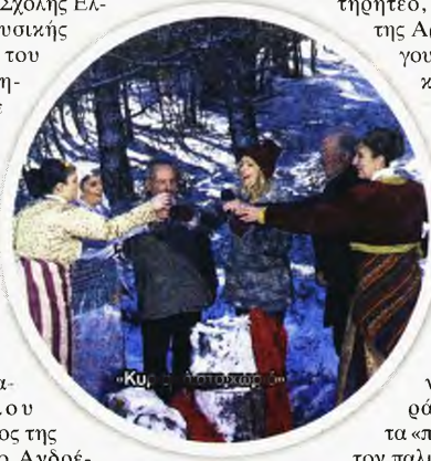
Κυριακή στο χωριό

Η ΚΟΘ υποδέχεται το 2023 με δύο αριστουργήματα του 23ου αιώνα. Το μυθικό έργο του Καρλ Ορφ «Carmina Burana» προέκυψε από μια ανακάλυψη του συνθέτη διάφορων μεσαιωνικών ποιημάτων κάποιων αρνησθήσων και αφορισμένων μοναχών, που λάτρευαν τις κοσμικές απολαύσεις.